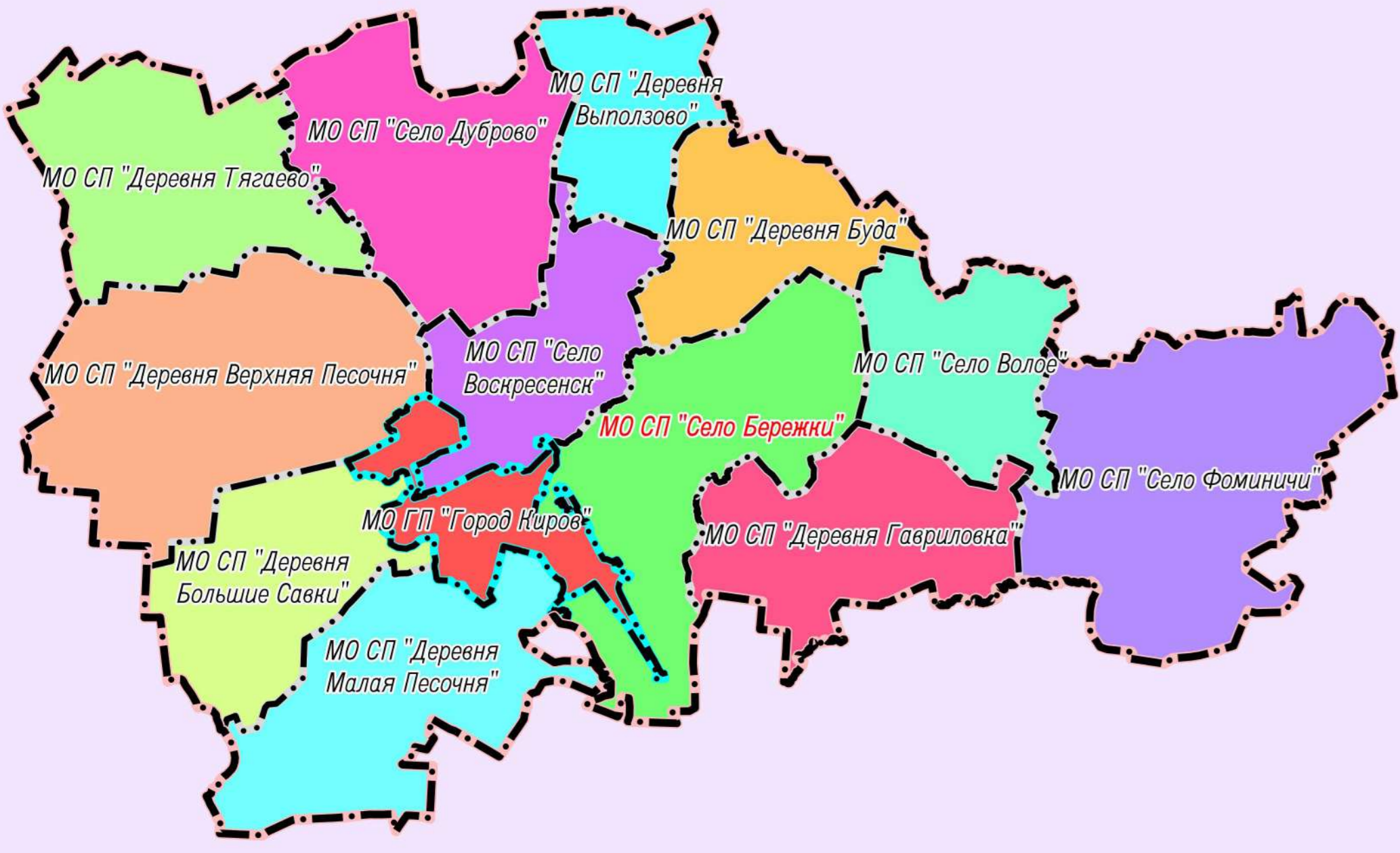
Схема размещения сельского поселения в структуре Кировского района