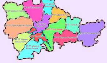
Схема размещения сельского поселения в структуре Кировского района

П Р А В И Л А З Е М Л Е П О Л Ь З О В А Н И Я И З А С Т Р О Й К И